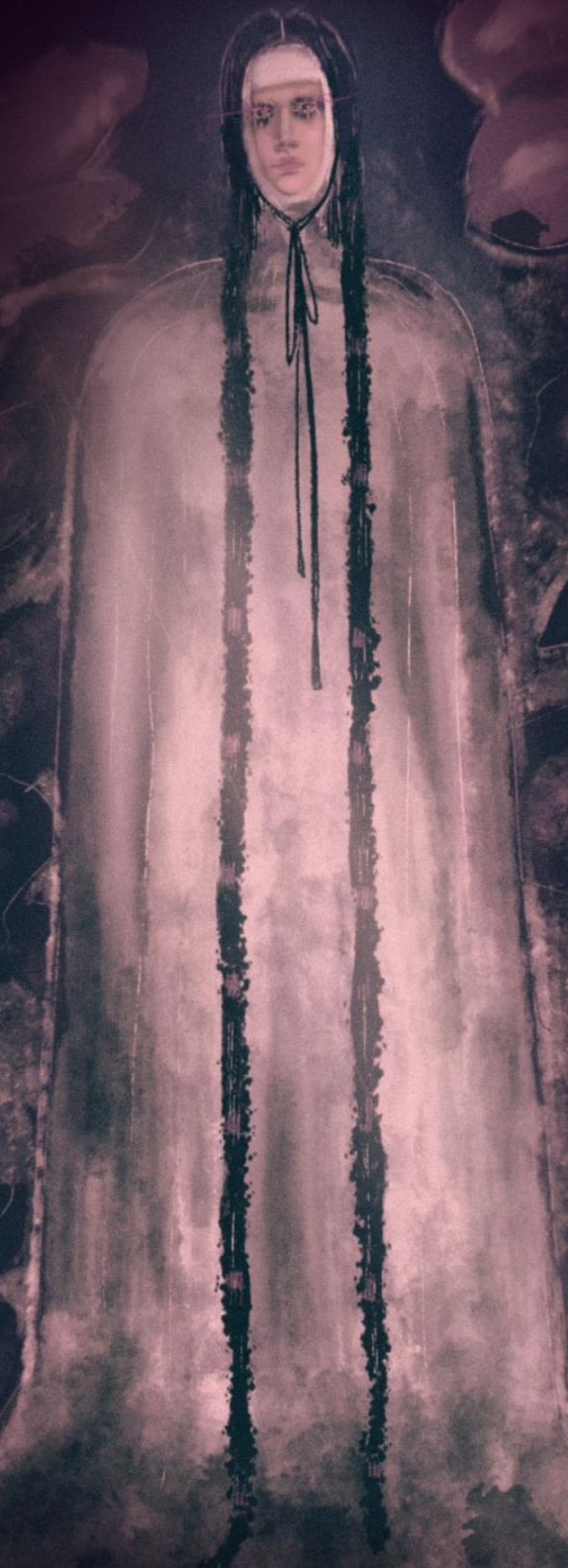
Тамара в 11 веке