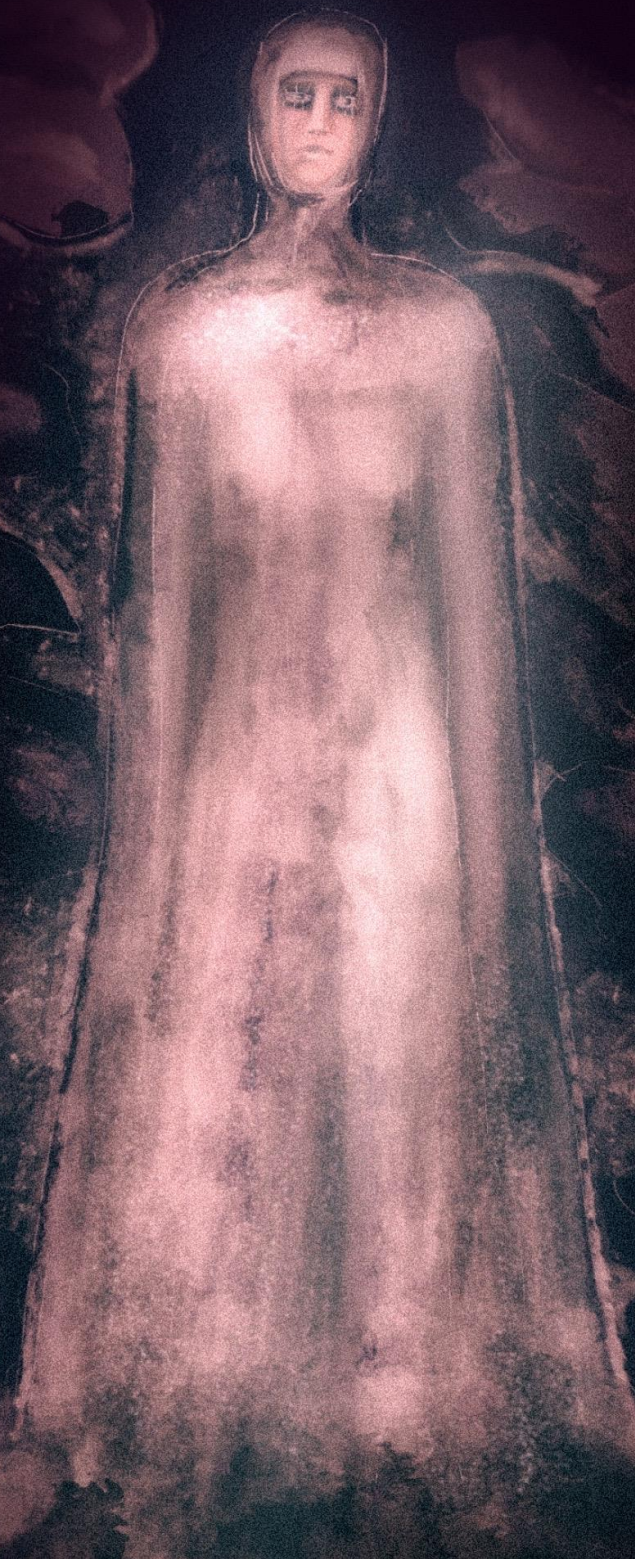
Тамара в монастыре