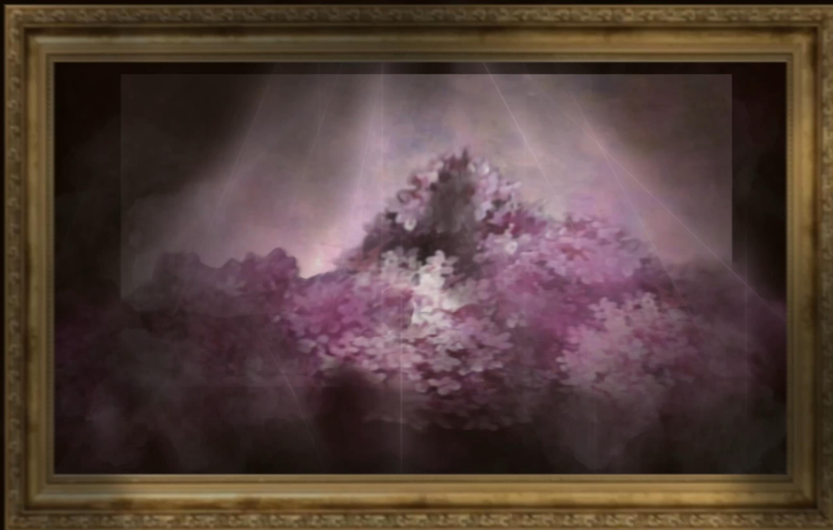
Экран с обратной проекцией