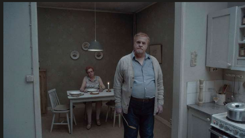
Кадр из фильма «О бесконечности» реж. Рой Андерссон