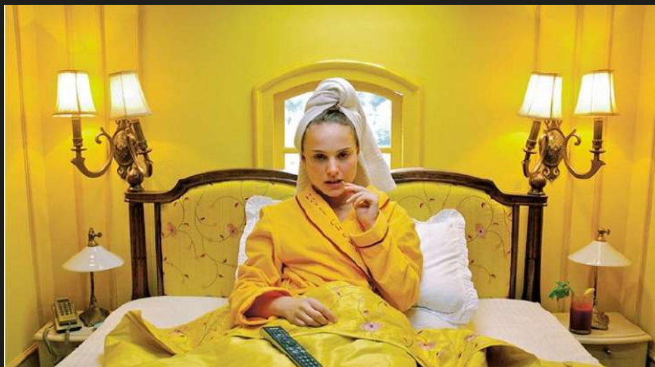
Кадр из короткометражного фильма «Отель Шевалье» реж. Уэс Андерсон