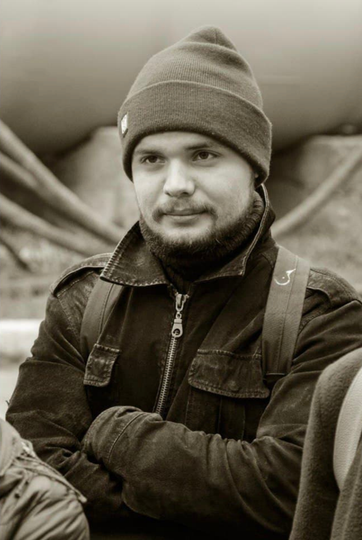
ДРАМАТУРГ ЕВГЕНИЙ ИОНОВ